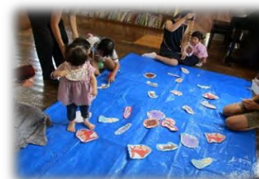
ひろばのなつまつり★