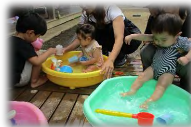
プールやタライで水遊び♪